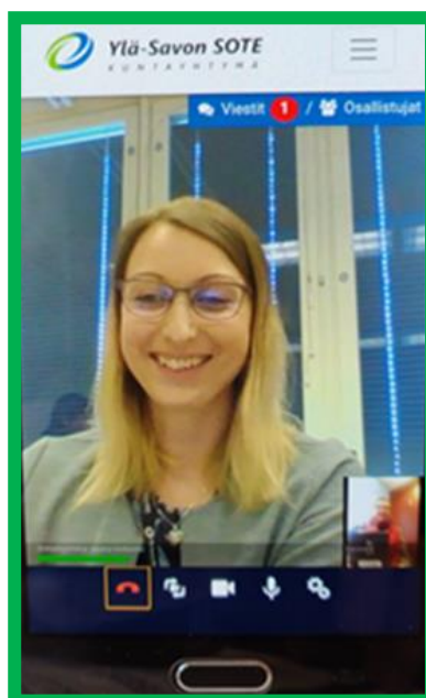
Kuva 2. Näkymä etävastaanottotilanteesta

Avaa puhelimestasi linkki sinulle varattuna aikana (jos yrität avata linkkiä liian aikaisin, niin saat virheilmoituksen).